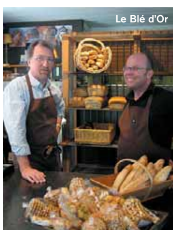
Le Blé d'Or