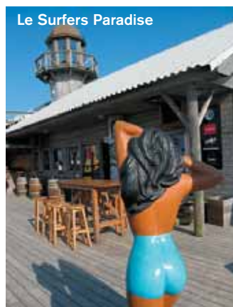
Le Surfers Paradise