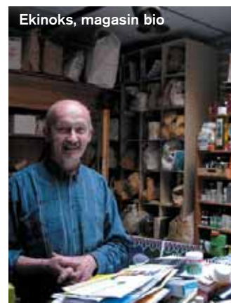
Ekinoks, magasin bio