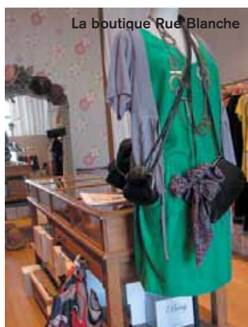
La boutique Rue Blanche