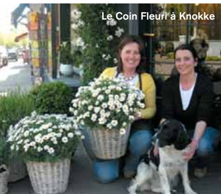
Le Coin Fleuri à Knokke