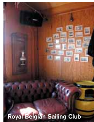
Royal Belgian Sailing Club