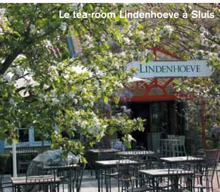
Le tea-room Lindenhoeve à Sluis