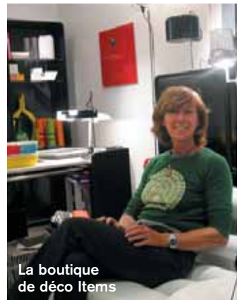
La boutique de déco Items