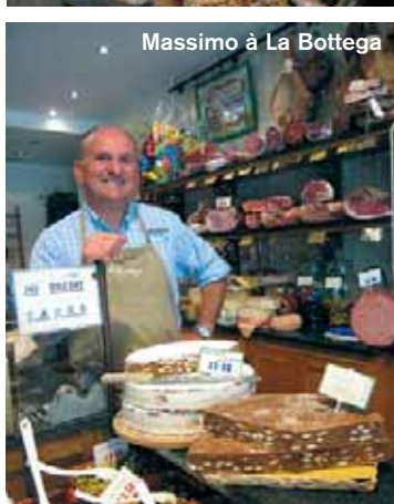
Massimo à La Bottega