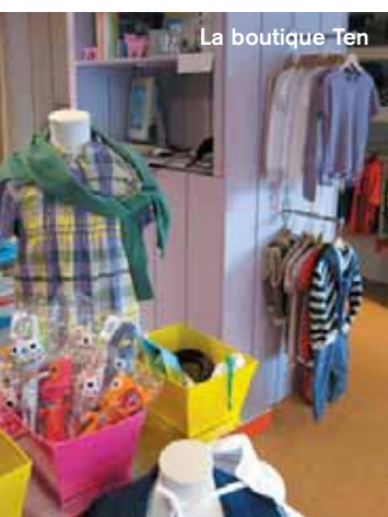
La boutique Ten

« Pour le lunch , le Picardy (Zeedijk, 803 ; 050 62 55 61) et sa terrasse sur la digue permettent de prendre le soleil. C'est le resto-brasserie fréquenté par les locaux. On y mange notamment des croquettes de crevettes et de fromage à un prix raisonnable. Pour le midi également, le Coup Vert by Sovereyns (Sparrendreef, 92 ; 050 62 70 14) propose une carte originale et raffinée, avec des pointes d'influences asiatiques par exemple. Pour le dîner , pourquoi pas Le Boudin sauvage (Graaf Jansdijk, 270 ; 050 60 81 79), avec sa cuisine française et ses fondues. »