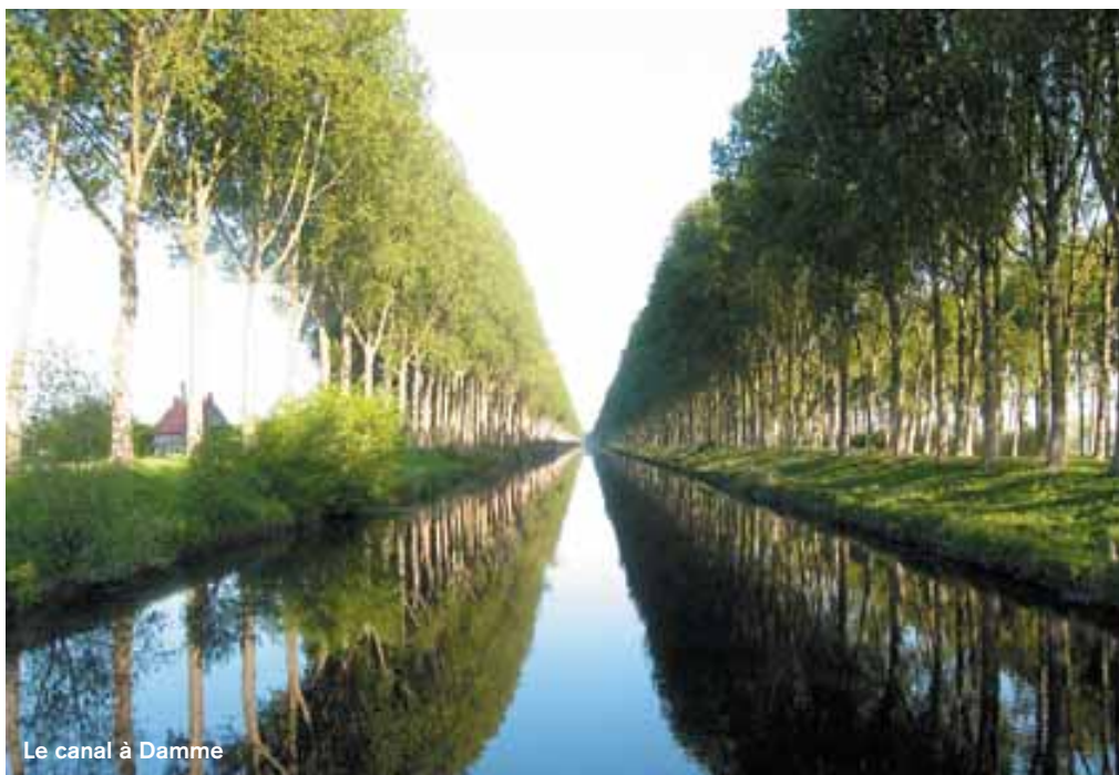
Le canal à Damme