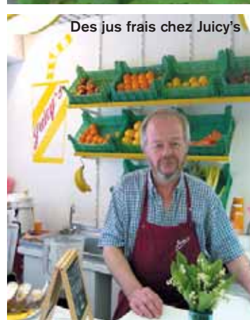
Des jus frais chez Juicy's