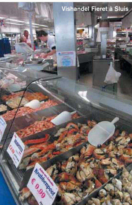
Vishandel Fieret à Sluis