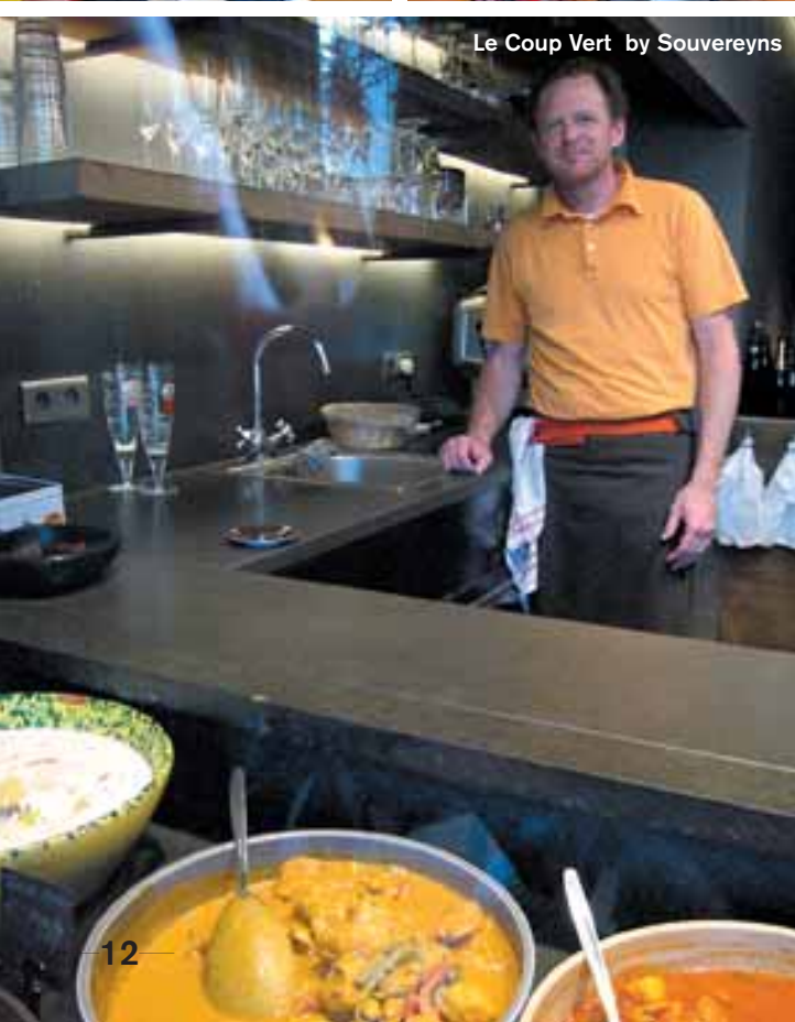
Le Coup Vert by Sovereyns

« D'un point de vue professionnel, un magasin en particulier propose développements photos et bon matériel assorti de judicieux conseils : Foto - Video Leurs (Dumortierlaan, 28 ; 050 60 72 86). Et je reste bien sûr fidèle à la galerie qui a exposé mon travail de photo artistique, Geukens & De Vil (Zeedijk, 735 ; 050 62 41 92 ; www.geukensdevil.com ). Elle est spécialisée en art contemporain, toutes disciplines confondues (peinture, collages, photo, sculpture...). »