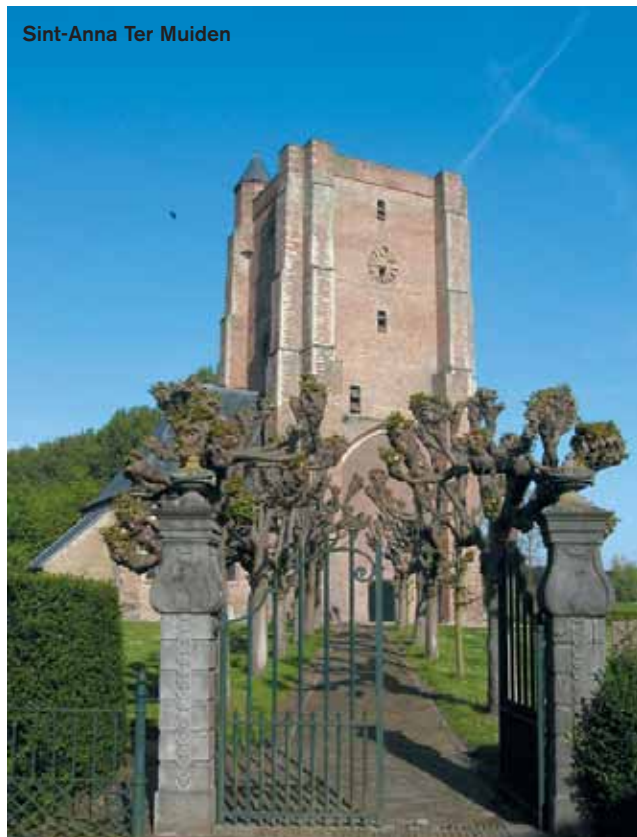
Sint-Anna Ter Muiden

« En grande amatrice de la nature, le Zwin (Gr. L. Lippensdreef, 8 ; 050 60 70 86 ; www.west-vlaanderen.be/zwin ) et le Jardin des Papillons (Bronlaan, 14 ; 050 61 04 72 ; www.vlindertuin-knokke.be ) demeurent pour moi des incontournables. Ce jardin des papillons est une bulle de paix, de douceur, de chaleur, de légèreté. J'aime aussi les balades sur la plage ou dans l'arrière-pays. On peut par exemple aller manger une glace dans une maison d'hôtes en pleine nature, sur la route de Sluis quand on quitte Knokke, après Kinder Siska : Hoeve Hazegras (Hazegrasstraat, 122 ; 050 60 22 08 ; www.hazegras.be ). On y loue des chambres et des appartements selon une formule de tourisme à la ferme . Dans le verger juste