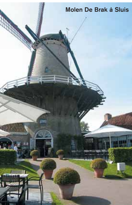
Molen De Brak à Sluis