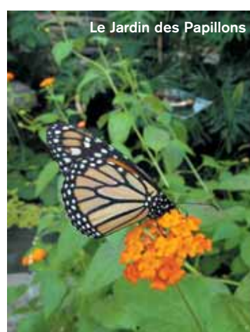
Le Jardin des Papillons